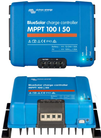
Solar Charge Controller MPPT 100/50