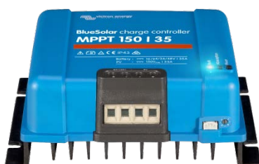
Zonne-laadcontroller MPPT 150/35