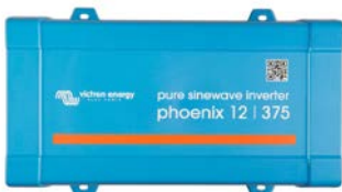
Phoenix 12/375 VE.Direct