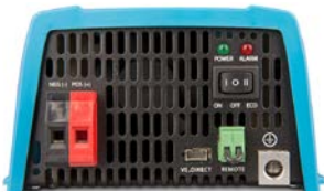
Phoenix 12/375 VE.Direct