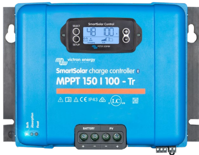
SmartSolar laadcontroller MPPT 150/100-Tr met optioneel koppelbaar display