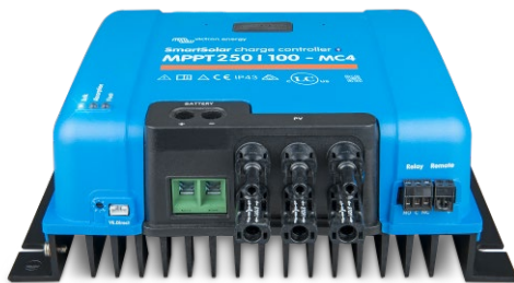
SmartSolar laadcontroller MPPT 150/100-MC4 zonder display