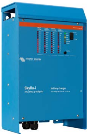
Skylla-i 24/100 (3)