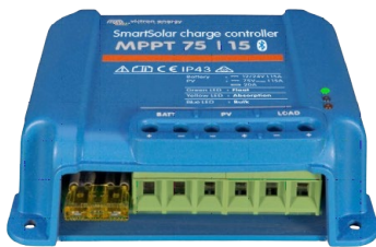
SmartSolar Laadcontroller MPPT 75/15