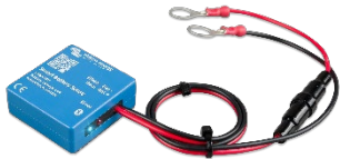
Bluetooth-detectie Smart Battery Sense