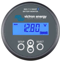
Bluetooth-detectie BMV-712 Smart Battery Monitor