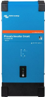
Phoenix Omvormer Smart 12/2000