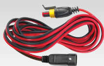
Verlengsnoer 2.5 m - 029057