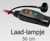
Laad-lampje 56 cm