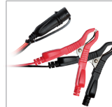
Klemmen (45 cm)