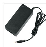
Laadblok 230V + kabel netspanning